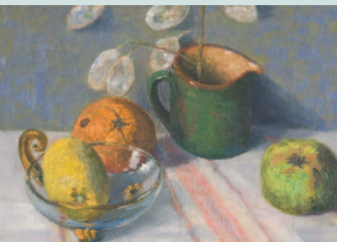
Hermine Overbeck-Rohte: Stilleben mit Zitrone, Apfelsine und Apfel, Öl/Lwd., nach 1905