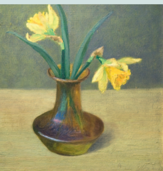
Hermine Overbeck-Rohte: Narzissen in brauner Glasvase, Öl/Karton, nach 1905

Finissage – Abschlussführung zu den schönsten Bildern der Ausstellung So 25. September, 15 h Overbeck-Museum 8 Euro