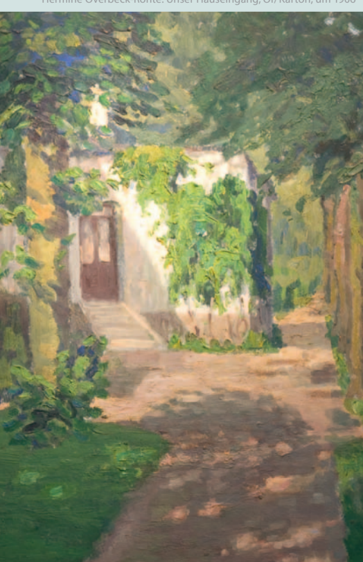
Hermine Overbeck-Rohte: Unser Hauseingang, Öl/Karton, um 1906