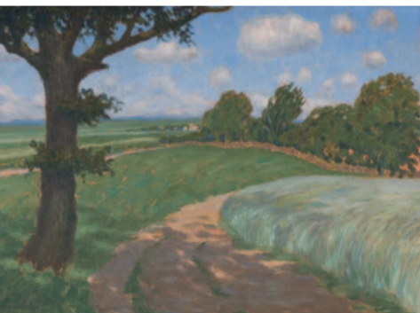
Hermine Overbeck-Rohte: Weg zum Basten, Öl/Karton, o. J.

Entdecken Sie mit Paula Modersohn-Becker eine Künstlerkollegin aus Worpswede: Das Paula Modersohn-Becker Museum und das Overbeck-Museum gewähren vom 29. Mai bis zum 25. September wechselseitige Ermäßigung – bitte Eintrittskarte aufbewahren und vorzeigen.