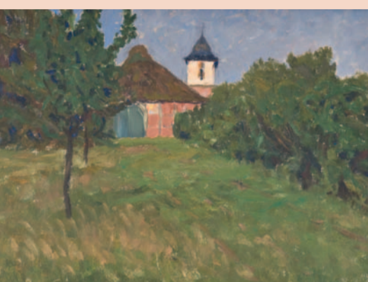
Hermine Overbeck-Rohte: Worpsweder Kirche, Öl/Karton, 1896/97