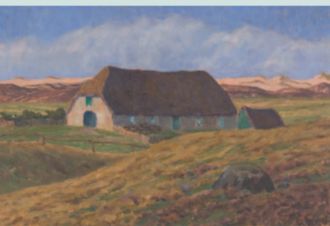
Hermine Overbeck-Rohte: Tante Ida, Öl/Lwd., 1912/1913