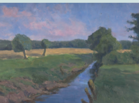
Hermine Overbeck-Rohte: An der Aue bei Sonnenuntergang, Öl/Karton, nach 1905

Malen auf den Spuren von Hermine Overbeck-Rohte im Schönebecker Auetal in Kooperation mit der Malschule Jorns Sa 2. Juli und So 3. Juli, 11 – 17 h Treffpunkt: Malschule Jorns, Borchshöherstraße 76, 28755 Bremen 96 Euro (für 2 Termine inkl. Material und Imbiss) Anmeldung und Informationen unter Tel. 0421 / 65 89 281